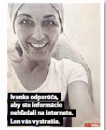
Ivana odporúča, aby všetky informácie získavali na internete. Len vďaka vystráha.

Najpúchšou oporou bol jej priateľ. Vraví, že pre ňu bolo až neuveriteľné, ako sa dá precítiť blízkosť druhého človeka. „On bol ten, kto úplne zblízka videl môj strach, moje „okno“ po každej návšteve lekárov na onkológiu. On videl, vnímal a prežíval každú moju emóciu. A poviem vám, bolo ich teda neučrekom. Práve on mi napríklad mojej prvotnej depresi zo zdieľaného prsníka, po niekoľkých vážnych vedľajších účinkoch prvej chemoterapie, po neovládanej únave či úplne holej hlave premenil život ľudskými prstov na štýl ultra all inclusive.“